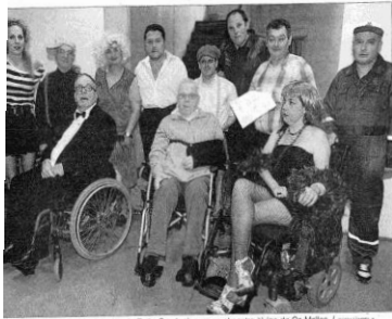
pres y miembros de la Asociación de Daño Cerebral, ayer en el centro cívico de Os Mallos.