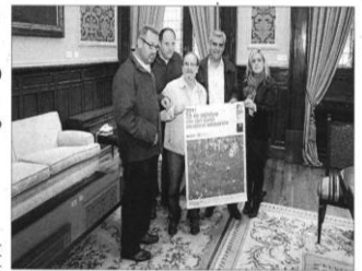
foto de los miembros de la presentación de las actividades, ayer, en el Ayuntamiento.