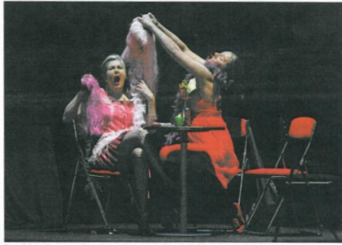
Un par de las actrices que se subieron al escenario para apoyar a la asociación Adaceco.